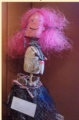
Objets fabriqués à partir de filets de pêche recyclés →