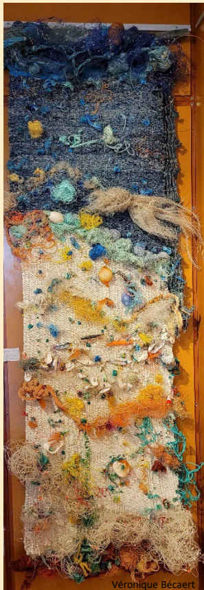
← Le tissage et une création d'enfants