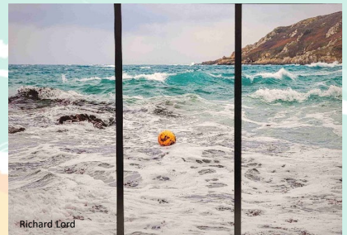
Bouée à Guernesey

On vous en parle depuis longtemps et ca y est, l'exposition des clichés Fish & Click a débuté. 25 photos sont présentées, de même qu'un tissage réalisé par une artiste bretonne Véronique Bécaert, 2 créations d'enfants de la classe de CM1 bleu de l'école Notre Dame de la Charité à St Pol de Léon et des objets fabriqués en filets de pêche recyclés.